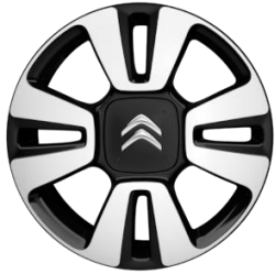
Jante aliaj diamantate 16" MATRIX (205/55 R16)