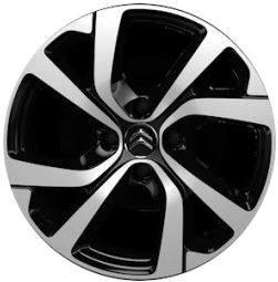
Jante aliaj diamantate 17" VECTOR (205/50 R17) - optional