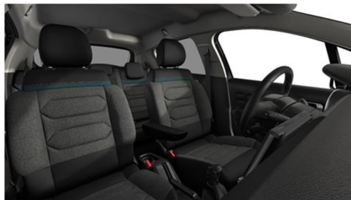
Tapiterie textila Emeraude (UKFL)