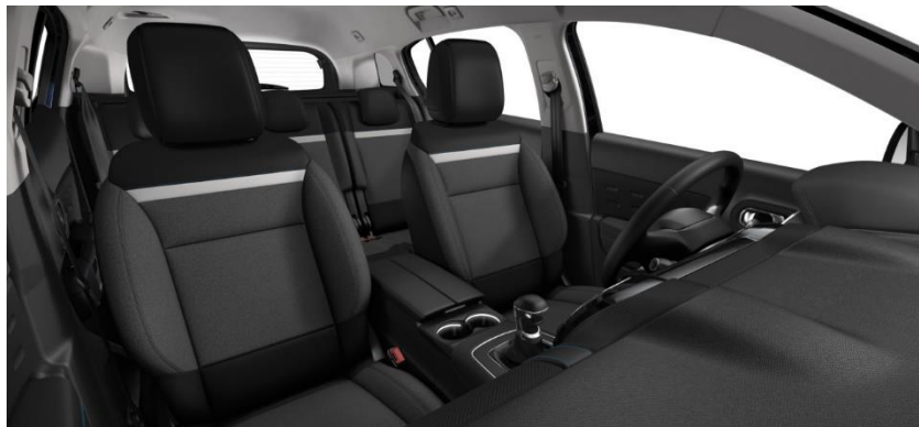
Tapiterie textilă Silica Grey (51FR)