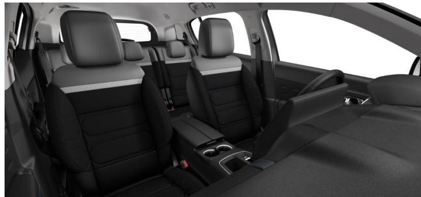
Tapiterie mixtă Wild Black (V4FC)