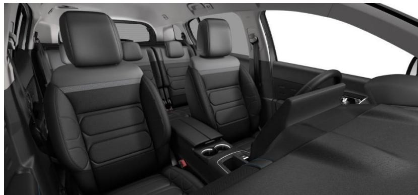
Tapiterie mixtă Metropolitan Black (TKFF)