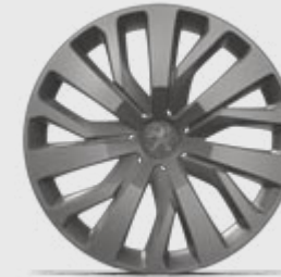
Capac roată 16" TONGARIRO