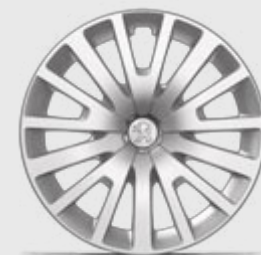
Capac roată 15" MILFORD

Descoperă cele 5 modele de jante* sau capace de roată* de dimensiuni cuprinse între 15" și 17".