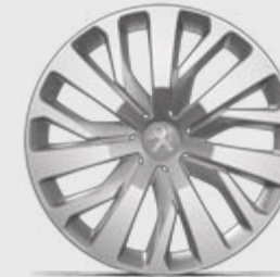
Capac roată 16" RAKIURA