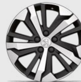
Jante aliaj diamantate 17" AORAKI

* Dotare standard, opțională sau indisponibilă, în funcție de versiune.