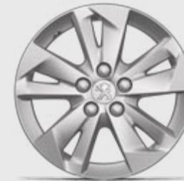
Jante aliaj 16" TARANAKI