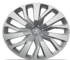
capace 16" RAKYURA