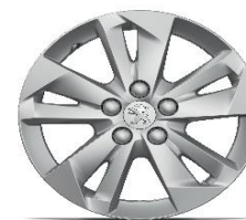
jante aliaj 16" TARANAKI