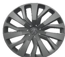
capace 16" TONGARIRO