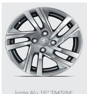
Jante Alu 16" TAKSIM