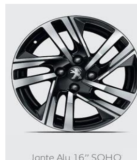
Jante Alu 16" SOHO