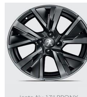
Jante Alu 17" BRONX