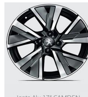
Jante Alu 17" CAMDEN