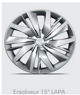
Enjoliveur 15" LAPA