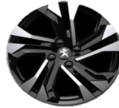
Jante aliaj diamantate 17''