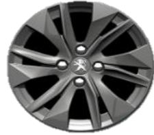
Jante aliaj 16''