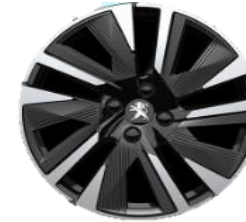
Jante aliaj diamantate cu insertii gri 18''