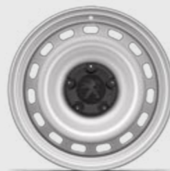
Jante tablă 15''