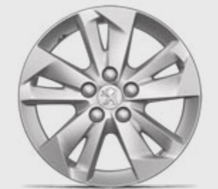
Jante aluminiu TARANAKI 16''