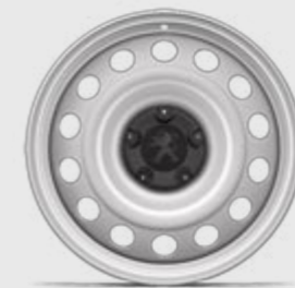
Jante tablă 16''