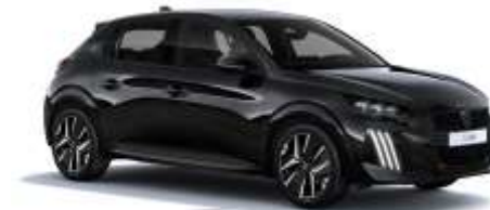
Negru „Perla Nera”