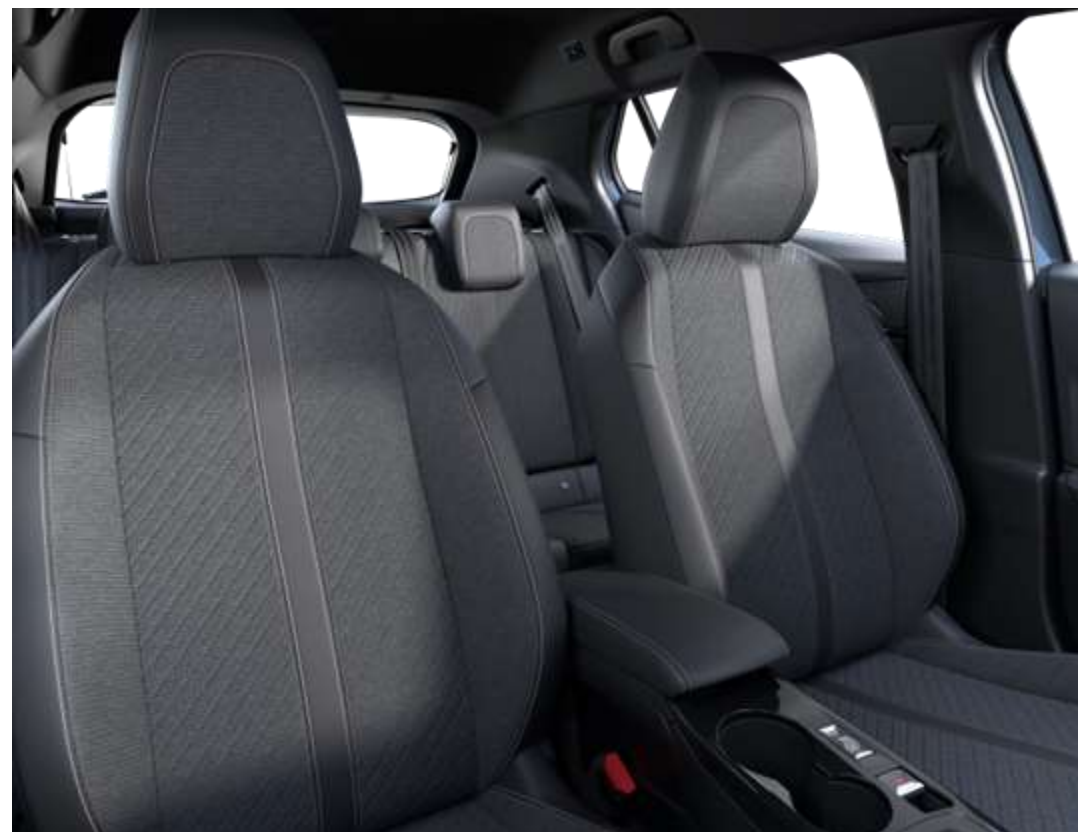
Tapițerie CASUAL LOMSA cu țesătură în relief, material TEP Isabella, material LOMSA și cusături Quartz