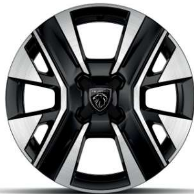
Jante aliaj de 16" „diamond cut”