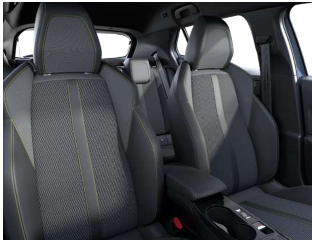
Tapițerie BELOMKA, cu material TEP Isabella, țesătură Uni Capy și cusături Adamite Verde