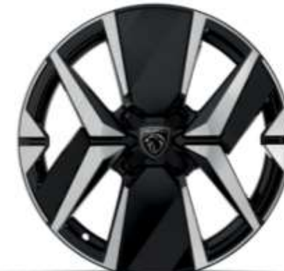
Jante aliaj de 17" „diamond cut”