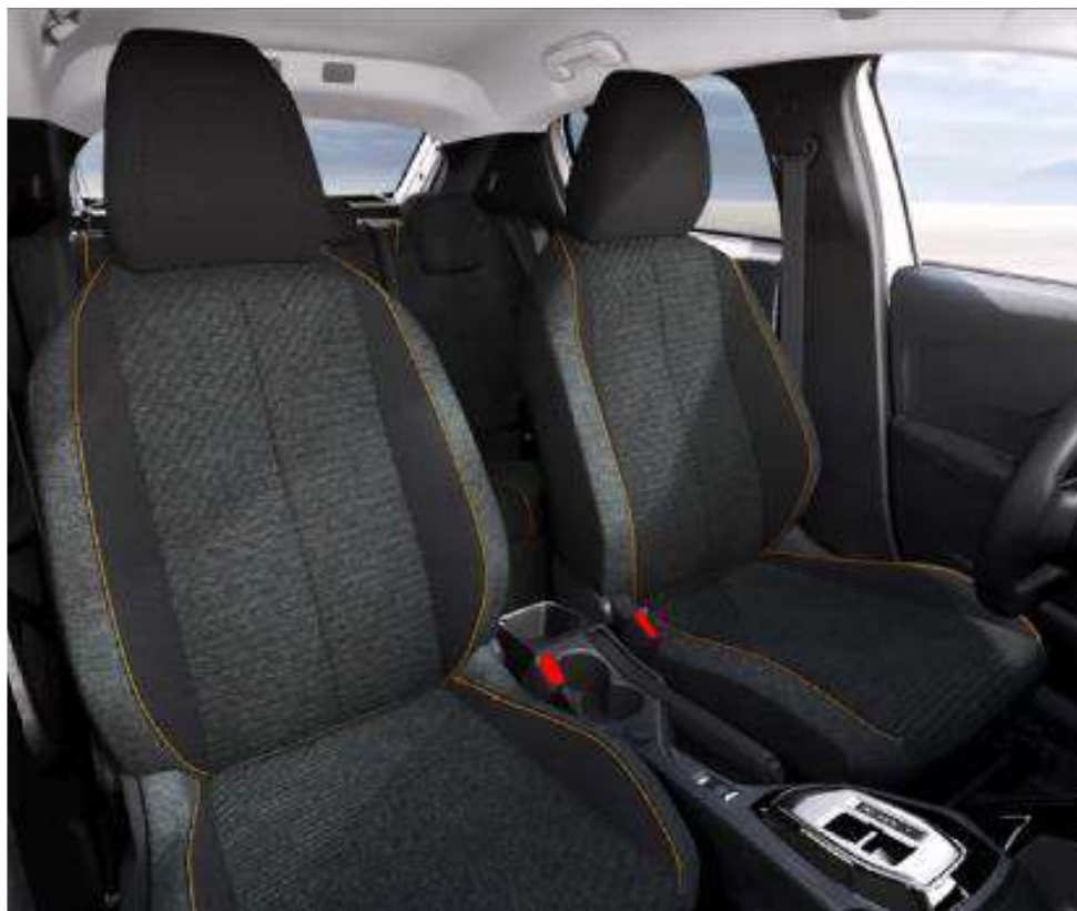
Tapițerie din țesătură RENZO și cusături de culoare portocalie