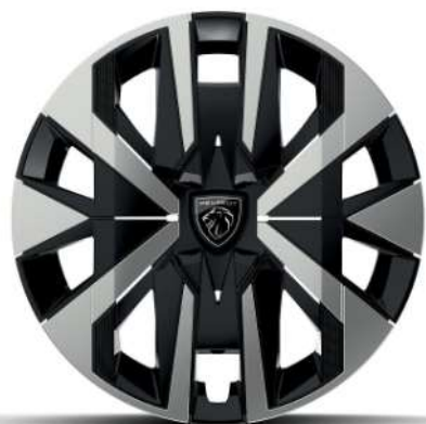
Jante oțel de 16"