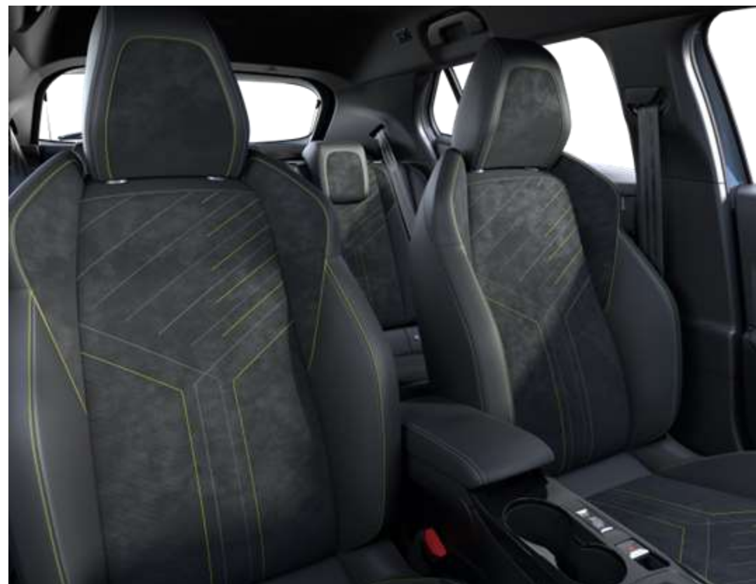
Tapițerie Mistral ICONIUM Alcantara® cu material TEP Isabella, piele Alcantara neagră și cusături Adamite Verde