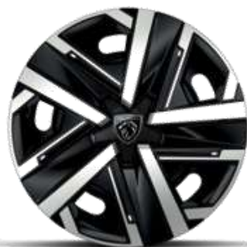
Jante de oțel SILOM de 16"