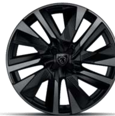
Jante diamantate bi-ton EVISSA din aliaj de 18"

Standard pe nivelele de echipare ALLURE și GT