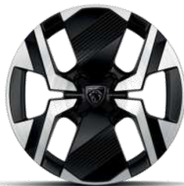
Jante diamantate bi-ton KARAKOY din aliaj de 17"

Standard pe nivelele de echipare ALLURE și GT