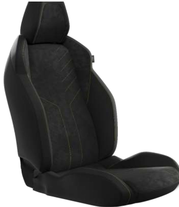
Tapițerie Mistral "ICONIUM" Alcantara® cu tapițerie TEP "Isabella" și cusături de culoare verde