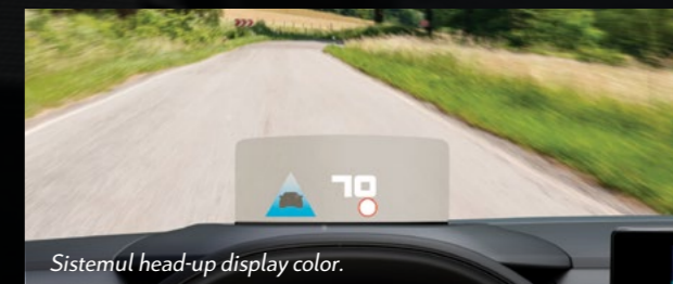
Sistemul head-up display color.

Sistemul de condus semi-autonom Highway Driver Assist este o combinație între regulatorul de viteză adaptiv cu funcție Stop&Go și un sistem de menținere a vehiculului pe banda de rulare. Conducătorul auto nu trebuie să gestioneze viteza sau traiectoria, aceste funcții sunt preluate de vehicul.