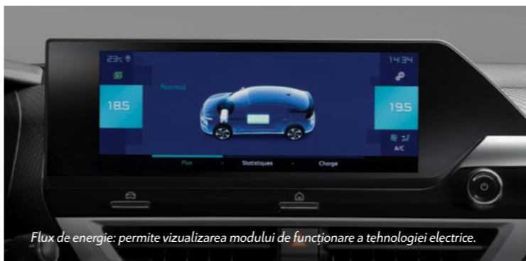
Flux de energie: permite vizualizarea modului de funcționare a tehnologiei electrice.