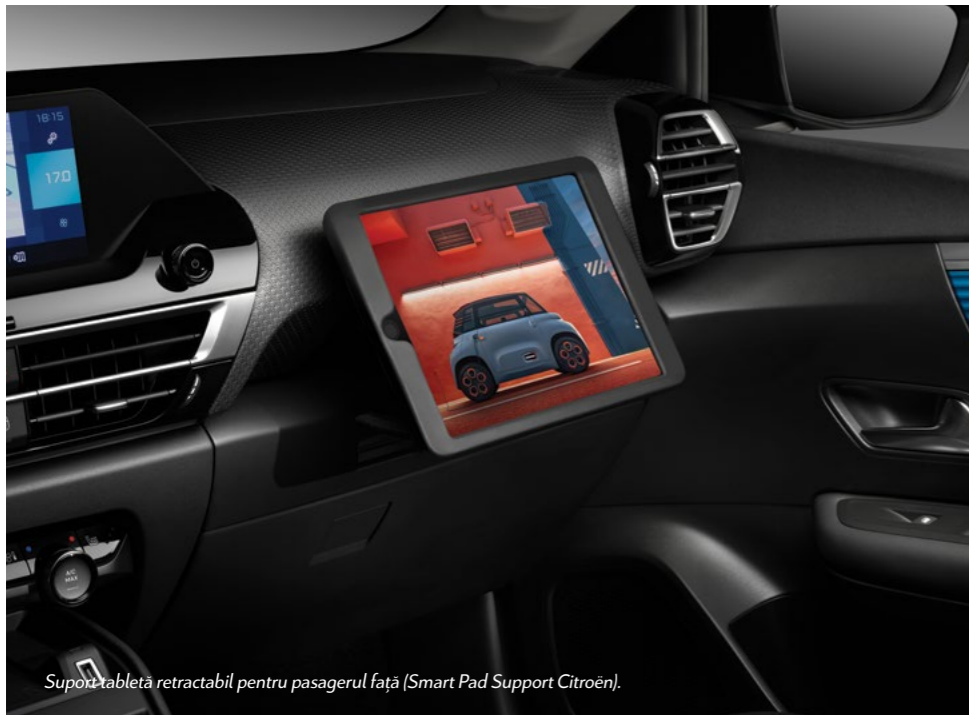
Support tabletă retractabil pentru pasagerul față (Smart Pad Support Citroën).