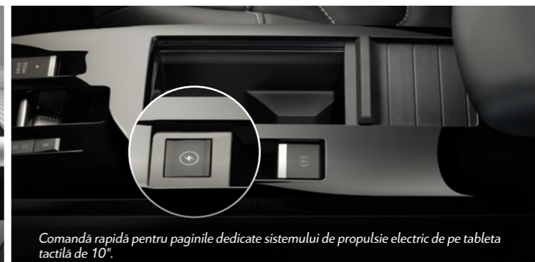
Comandă rapidă pentru paginile dedicate sistemului de propulsie electric de pe tableta tactilă de 10".