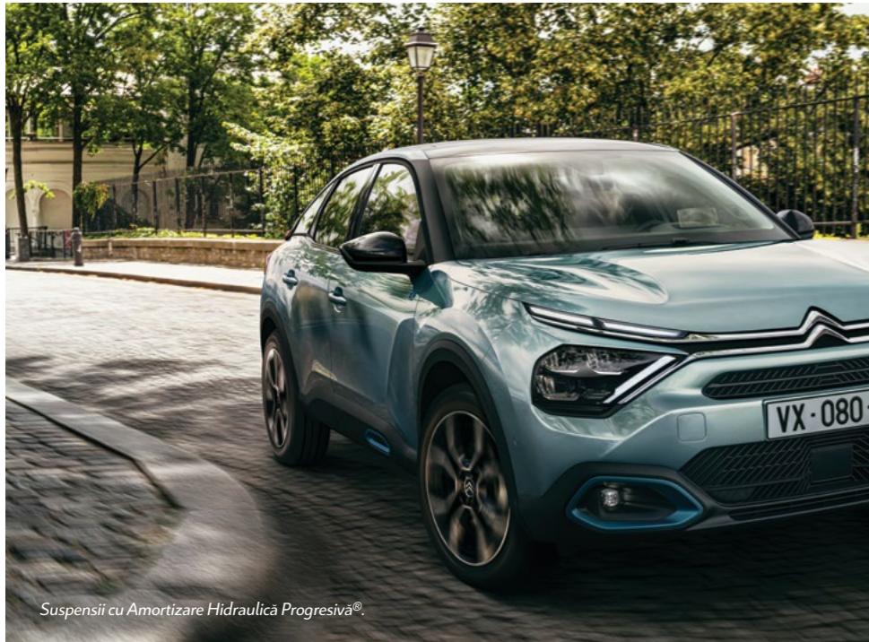
Suspensii cu Amortizare Hidraulică Progresivă®.