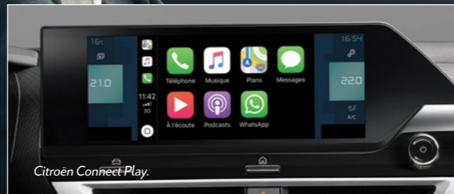
Citroën Connect Play.

Habitacul noilor Citroën ë-C4 – 100% electric și Citroën C4 inspiră încă de la prima vedere stare de bine și relaxare, grație planșei de bord elegante și moderne, panourilor portierelor cu linii delicate și consolei centrale înalte, de mari dimensiuni. Sistemul head-up display afișează toate informațiile utile la condus, ceea ce permite conducătorului auto să rămână concentrat asupra drumului. Amplasat în centrul planșei de bord, ecranul tactil de 10" de înaltă definiție regrupează toate comenzile mașinii.