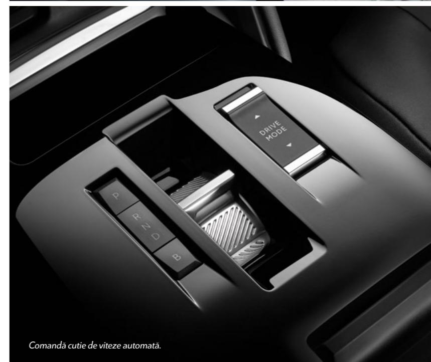
Comandă cutie de viteze automată.