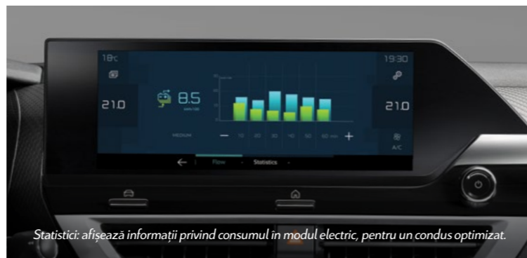
Statistici: afișează informații privind consumul în modul electric, pentru un condus optimizat.