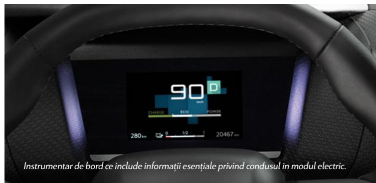
Instrumentarul de bord ce include informații esențiale privind condusul în modul electric.

amplasat în centrul planșei de bord afișează fluxul de energie și setările încărcării programate a bateriei. În timp ce mașina se încarcă, ecranul afișează informații legate de încărcare: timpul de încărcare rămas, autonomia recuperată, procentul de încărcare.