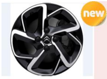
Jante aliaj diamantate 16" bi-ton HELLIX (205/55 R16) - optional