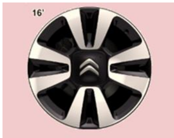
Jante aliaj diamantate 16" MATRIX (205/55 R16)