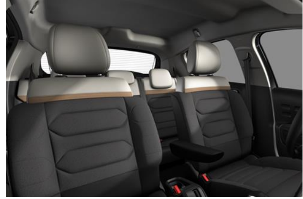
Tapiterie mixta material textil / TEP Techwood (V0FC)