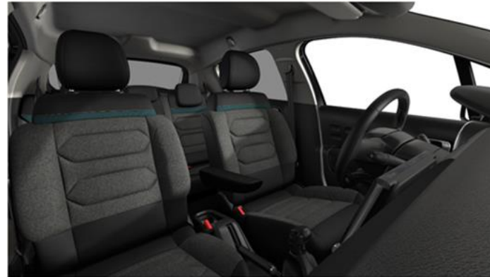
Tapiterie textila Emeraude (UKFL)