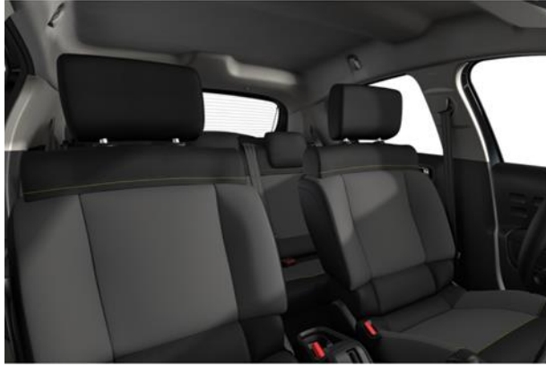
Tapiterie textila Mica Grey (23FR)