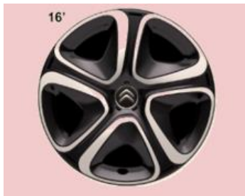
Jante tabla STEEL & STYLE 16" 3D (205/55 R16)