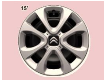
Jante tabla 15" cu capace ARROW (185/65 R15)