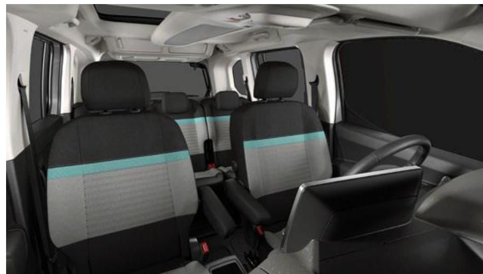
METROPOLITAN GREY (OFFT)