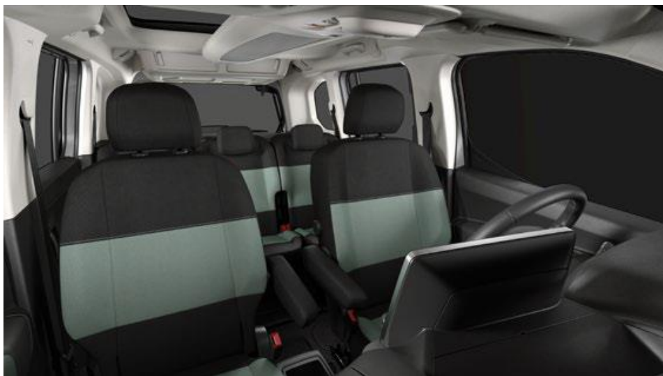
MICA GREEN (OEFQ)