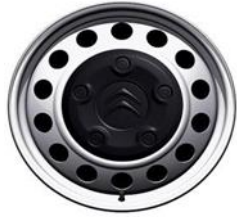
Jante tabla gri 16" (215/65 R16)