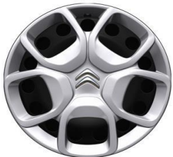
Jante tabla negre 17" cu capace (215/60R17)